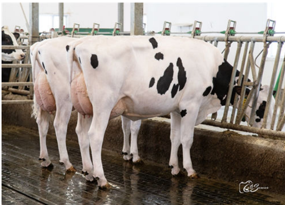
KNOWHOW DAUGHTER GROUP L TO R - LEOTHE KNOWHOW DEBBY, LEOTHE KNOWHOW GRAPHITE